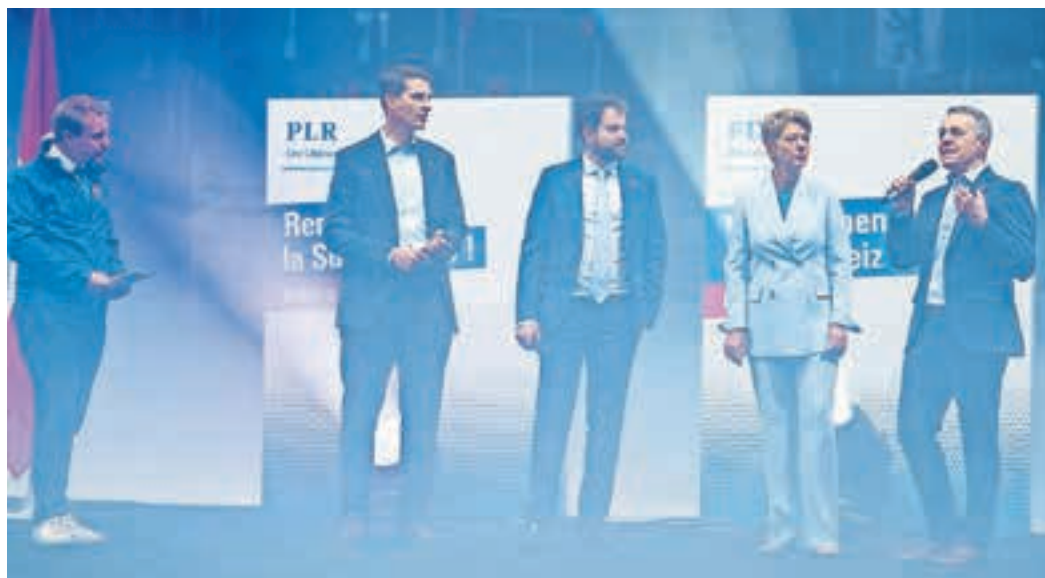
Bundesrat Ignazio Cassis im Austausch mit Bundesrätin Karin Keller-Sutter, Fraktionspräsident Damien Cottier, Parteipräsident Thierry Burkart und Moderator Philippe Nantermod (von rechts).