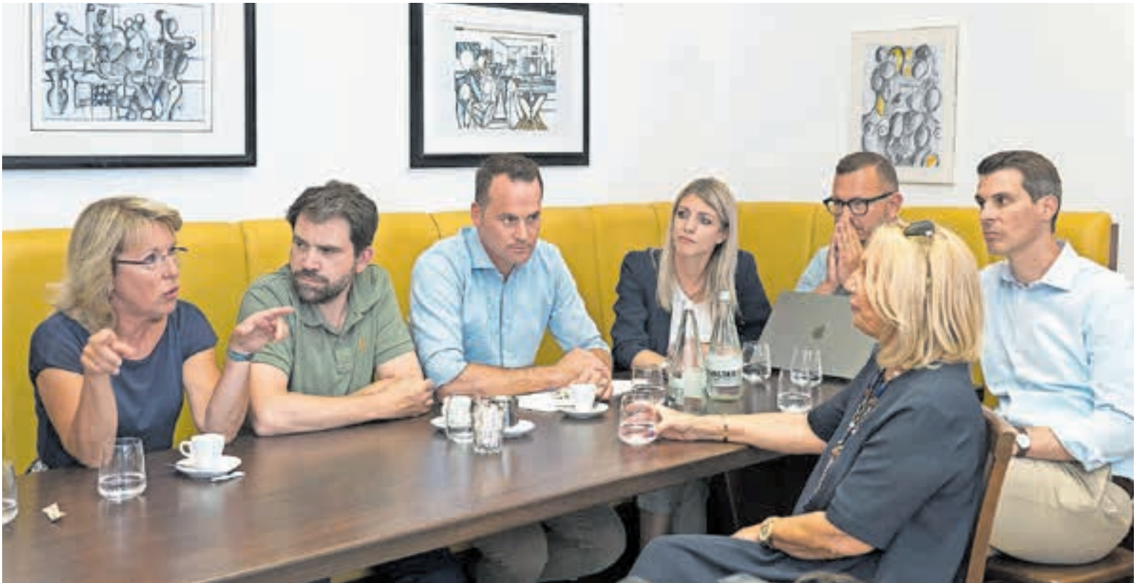
Eine namhafte FDP-Delegation tauschte sich in Chiasso mit den Lokalbehörden aus.

Mit der Aufnahme von über 60 000 Ukraine-Flüchtlingen hat die Schweiz seit März 2022 einen Kraftakt vollbracht und das Asylsystem vor einer Überlastung verschont. Der Schutzstatus S wurde erstmals aktiviert und hat sich weitgehend bewährt. Die FDP setzt sich dafür ein, dass der Schutzstatus S weiterhin rückkehrorientiert ausgestaltet und gegebenenfalls angepasst wird. Ein wichtiges Instrument sind auch Migrationspartnerschaften. Die FDP fordert eine Neuausrichtung, weil Migrationspartnerschaften helfen, Migration und Rückführungen besser zu steuern. Auf europäischer Ebene laufen derzeit Bestrebungen, den Migrationspakt zu reformieren. Die FDP hat eine Reihe von Fragen an den Bundesrat gestellt und will wissen, wie Schweizer Anliegen dort eingebracht werden können.