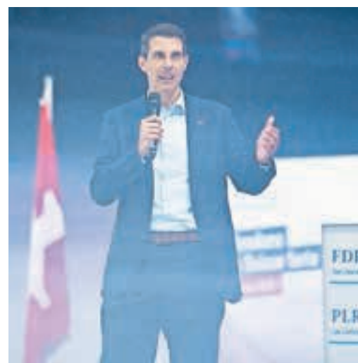
Parteipräsident Thierry Burkart betonte, dass die FDP für Aufbruch und nicht Stillstand steht.