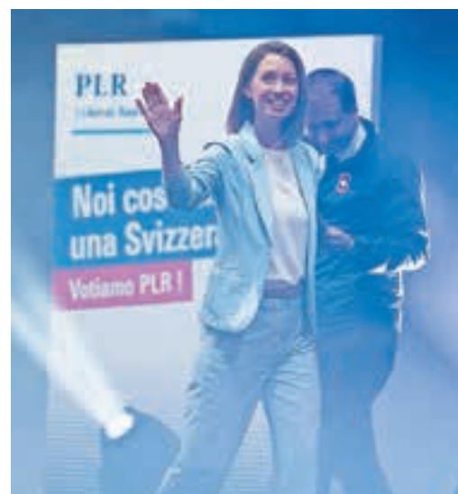
Für Vizepräsidentin und Ständerätin Johanna Gapany war es ein Heimspiel.