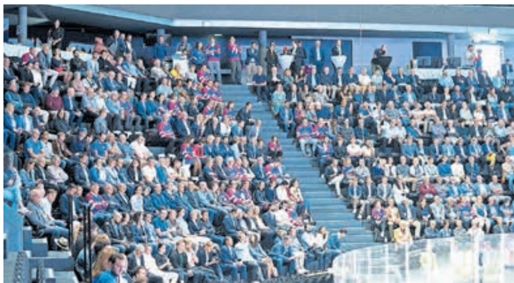
Rund 1000 Freisinnige strömten in das Eishockeystadion von Fribourg-Gottéron.