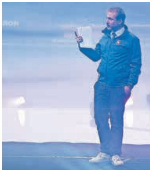
Nationalrat Philippe Nantermod führte mit viel Elan durch den Vormittag.